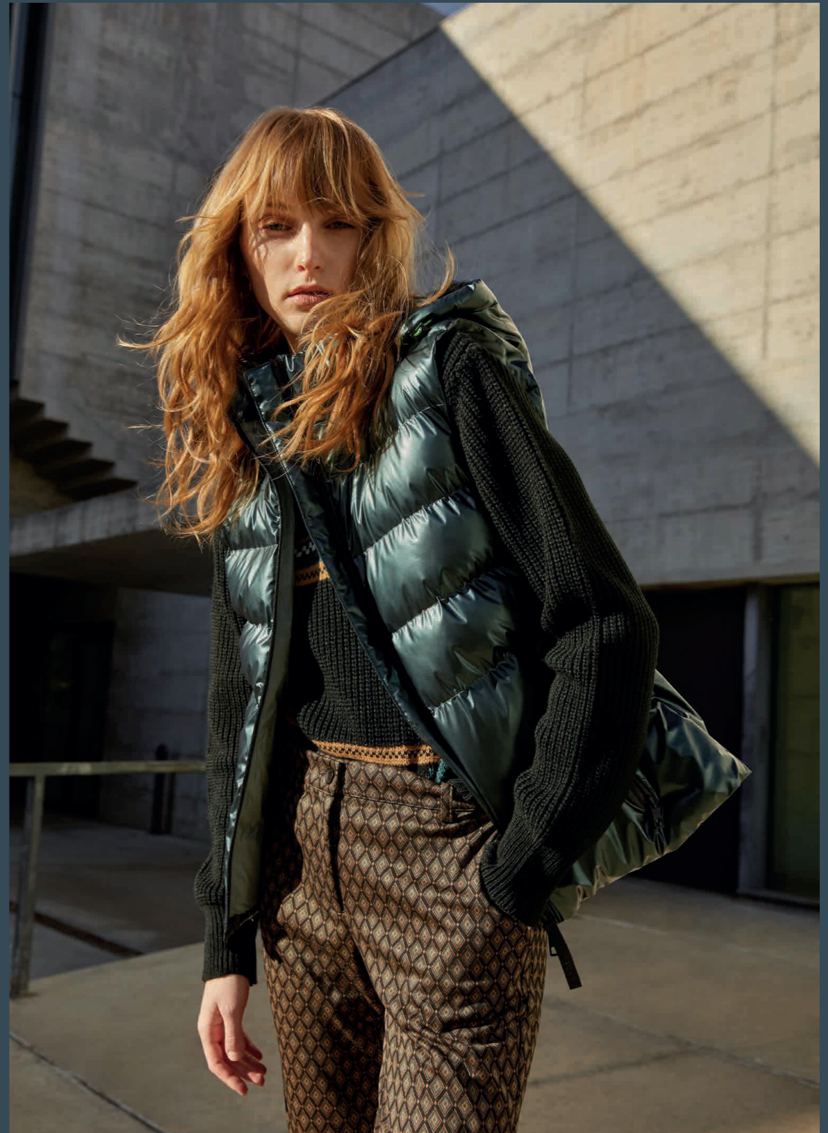
Jersey / Knit sweater : 6110 Pantalón / Trousers : 4400 Chaleco / Vest : 7021