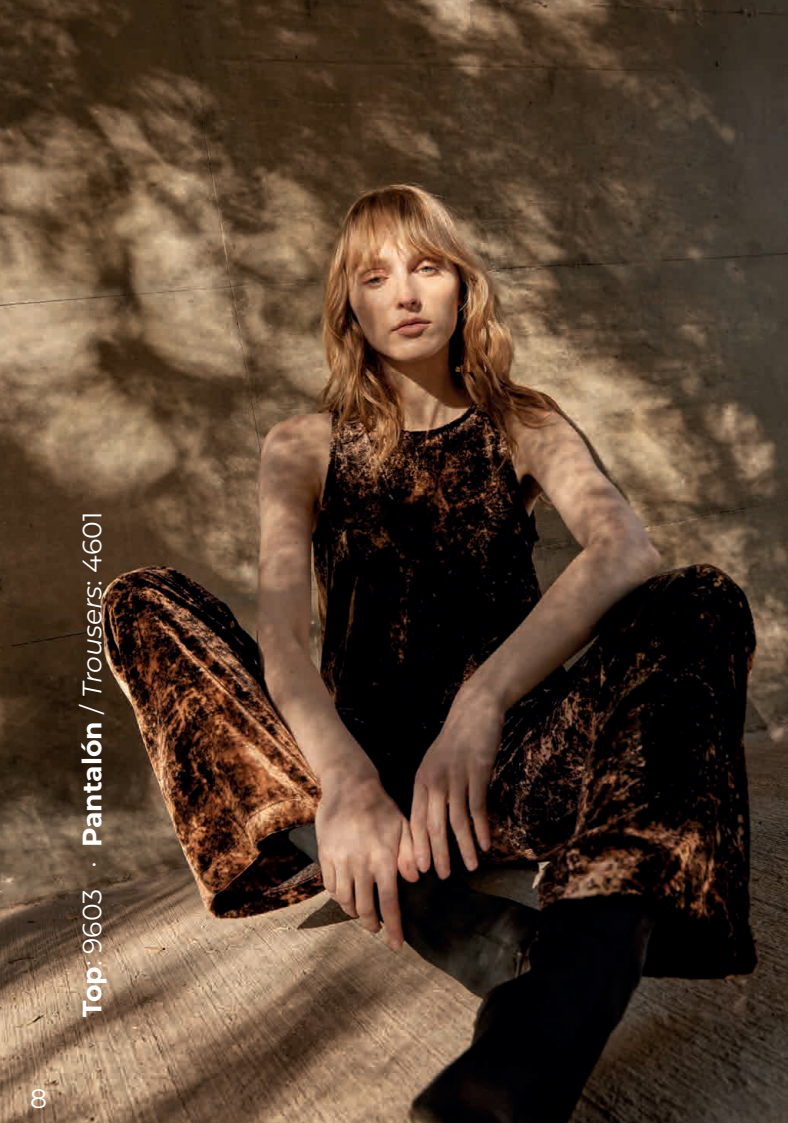
Top: 9603 · Pantalón / Trousers: 4601