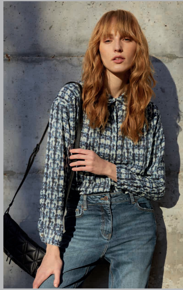
Camisa / Shirt: 2340 · Vaquero / Jeans: 4200 · Bolso / Handbag: 0001