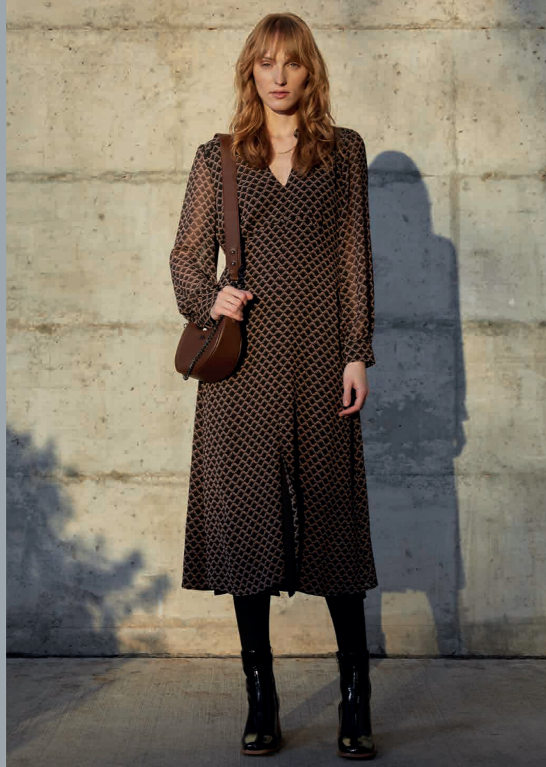
Vestido / Dress: 8331 · Bolso / Handbag: 0003