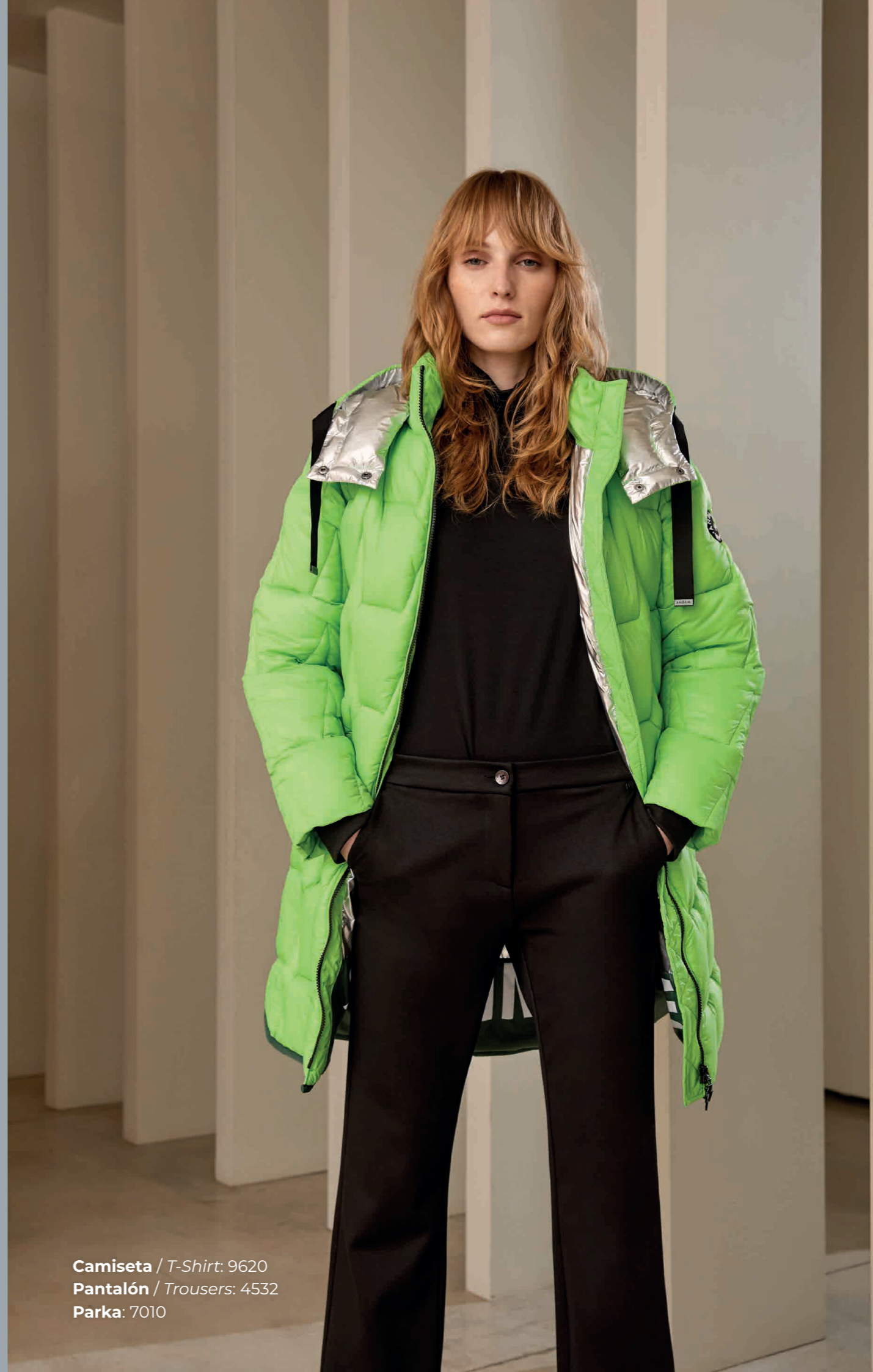
Camiseta / T-Shirt: 9620 Pantalón / Trousers: 4532 Parka : 7010