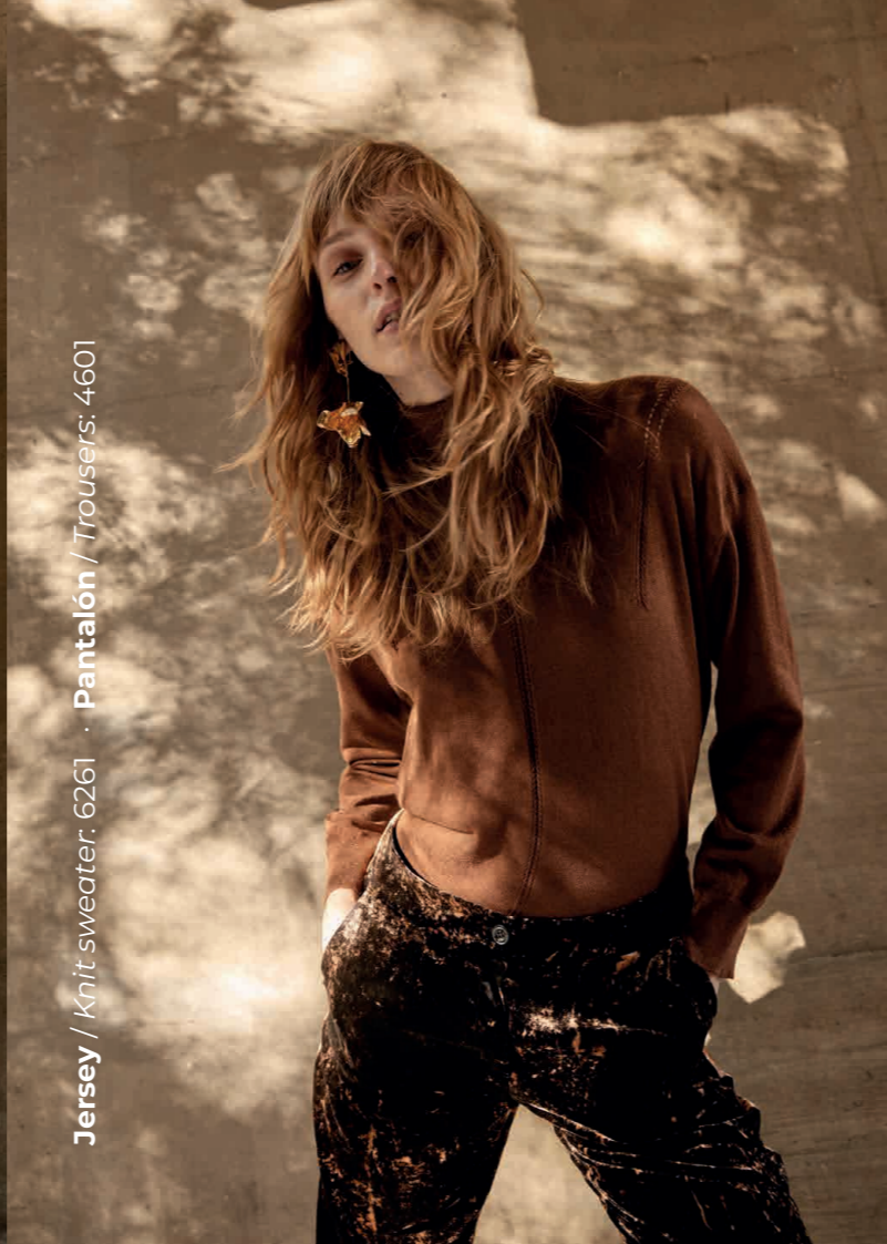
Jersey / Knit sweater: 6261 · Pantalón / Trousers: 4601