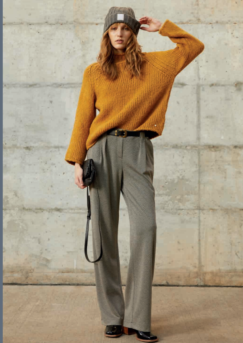
Jersey / Knit sweater: 6160 · Pantalón / Trousers: 4410 Gorro / Hat: 0008 · Bolso / Handbag: 0001 · Cinturón / Belt: 0007