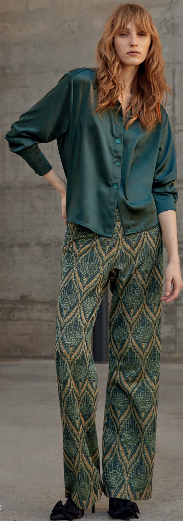
Camisa / Shirt: 2630 Pantalón / Trousers: 4660