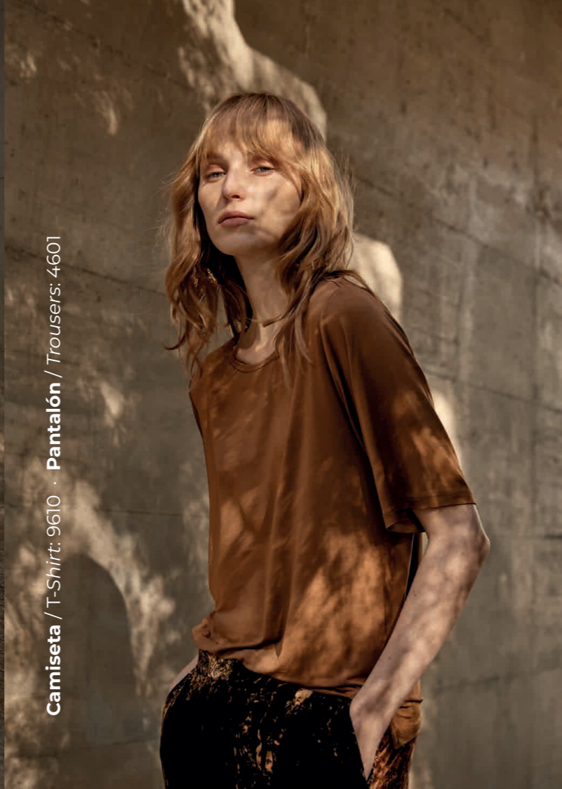
Camiseta / T-Shirt: 9610 · Pantalón / Trousers: 4601