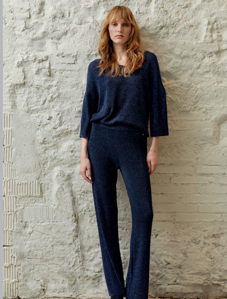
Jersey / Knit sweater: 6270 · Pantalón / Trousers: 4272