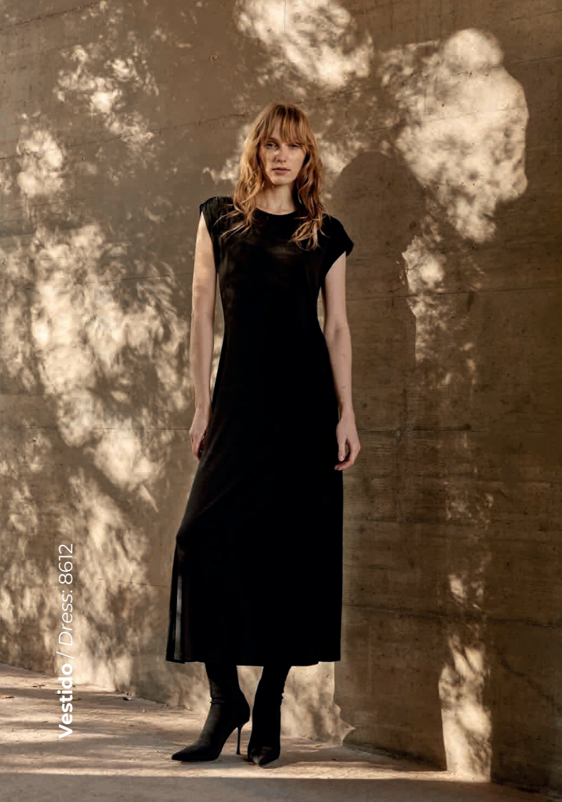
Vestido / Dress: 8612