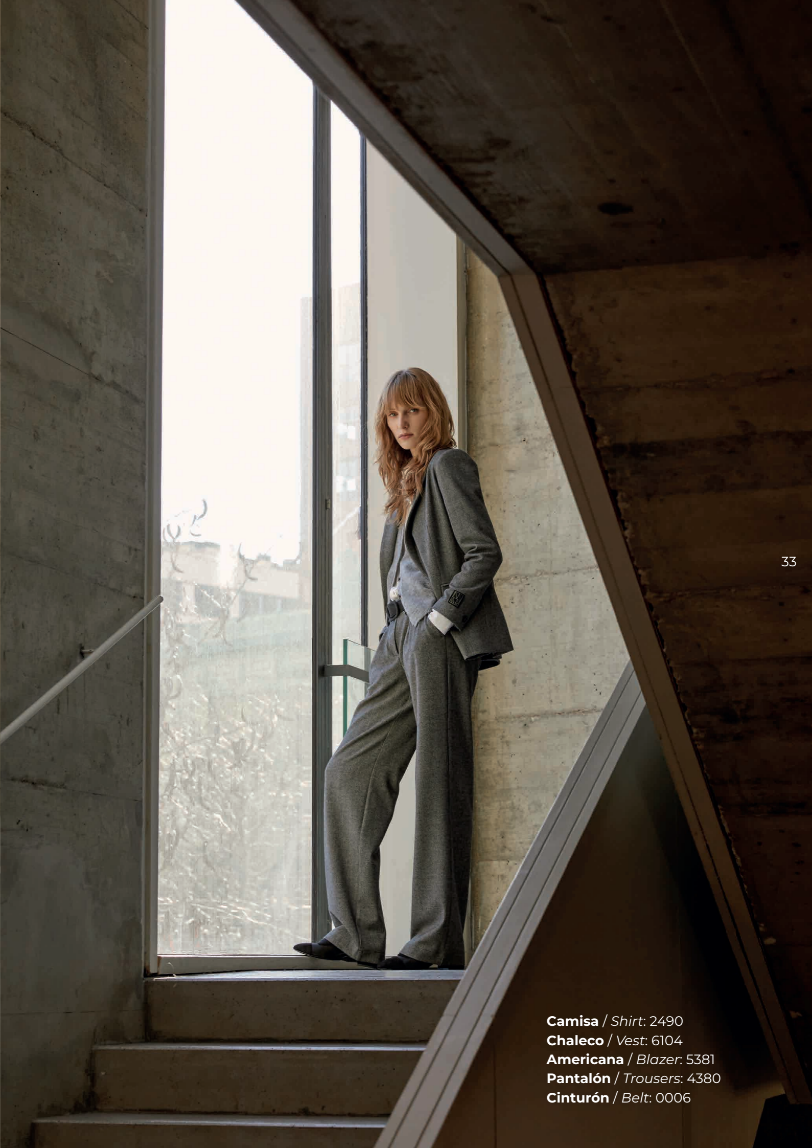
Camisa / Shirt: 2490 Chaleco / Vest: 6104 Americana / Blazer: 5381 Pantalón / Trousers: 4380 Cinturón / Belt: 0006