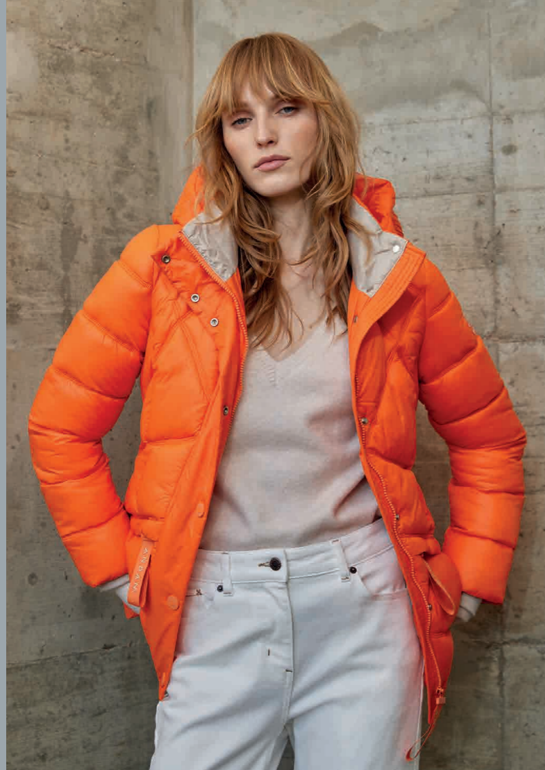
Jersey / Knit sweater: 6103 · Vaquero / Jeans: 4210 · Parka: 7011