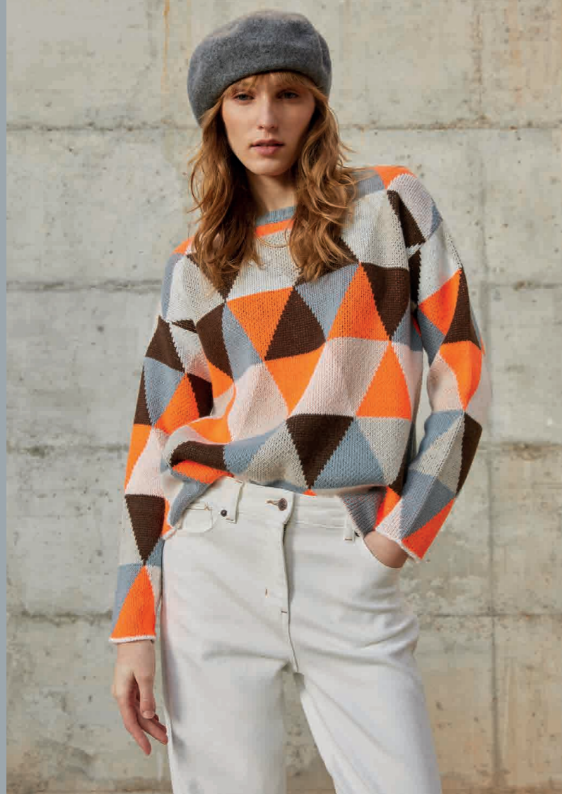
Jersey / Knit sweater: 6120 · Vaquero / Jeans: 4210