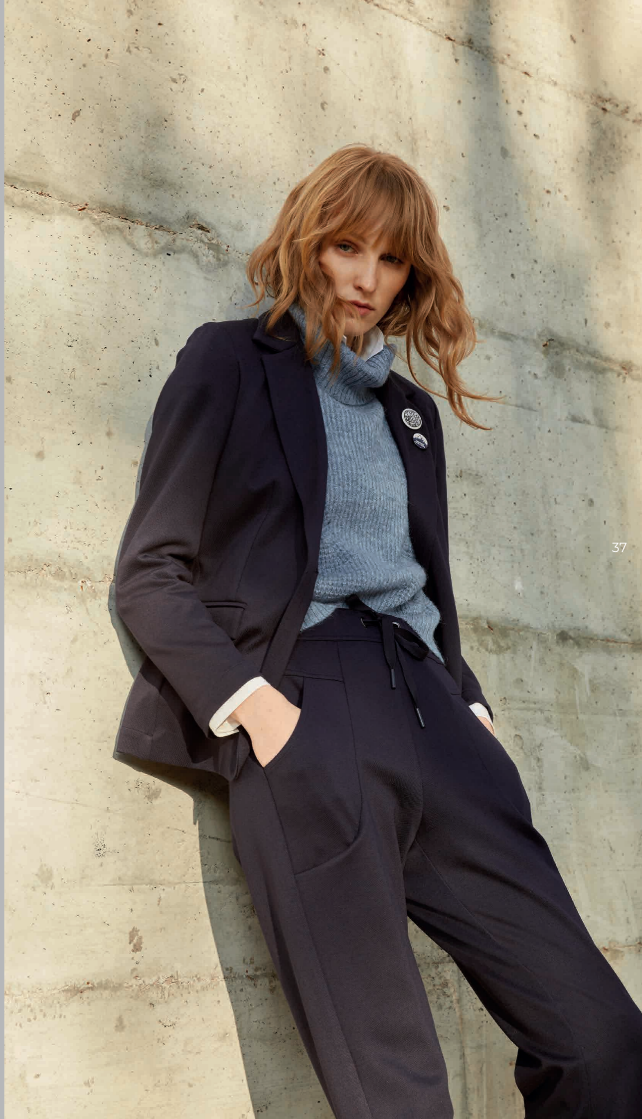
Camisa / Shirt: 2490 · Chaleco / Knit vest: 6171 · Americana / Blazer: 5533 · Pantalón / Trousers: 4531