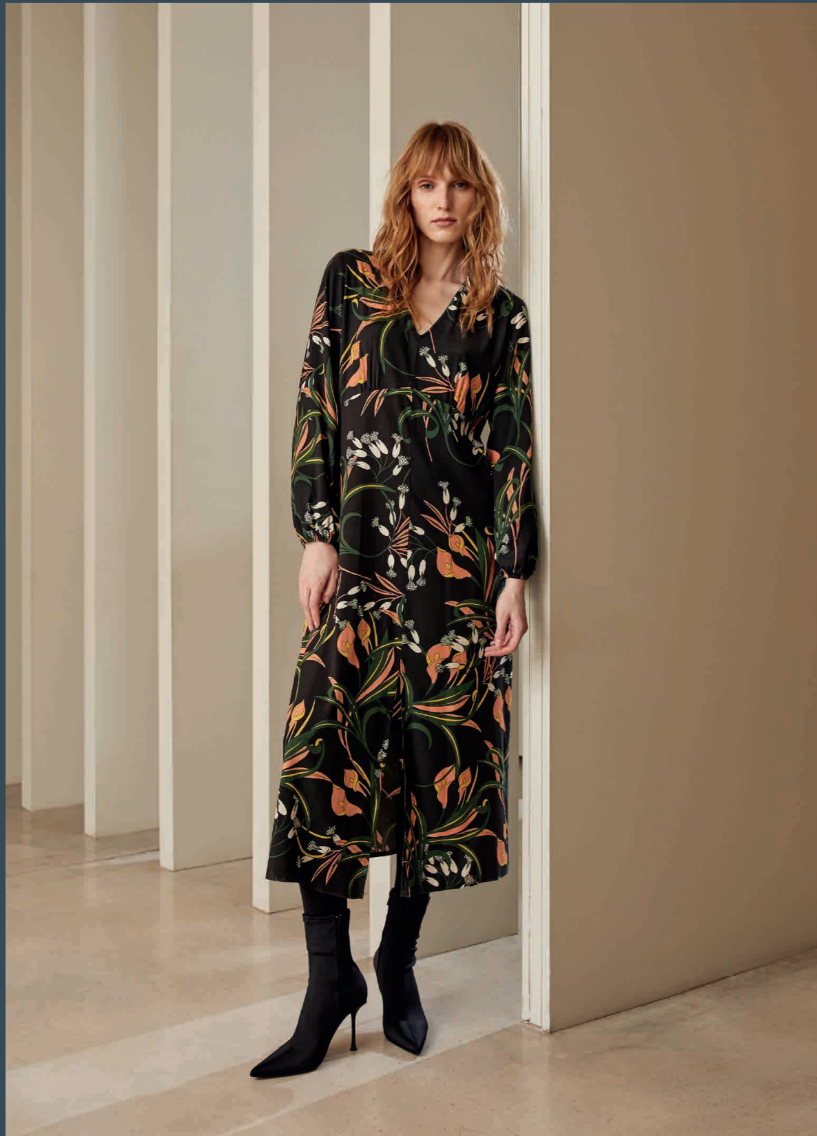
Vestido / Dress: 8351