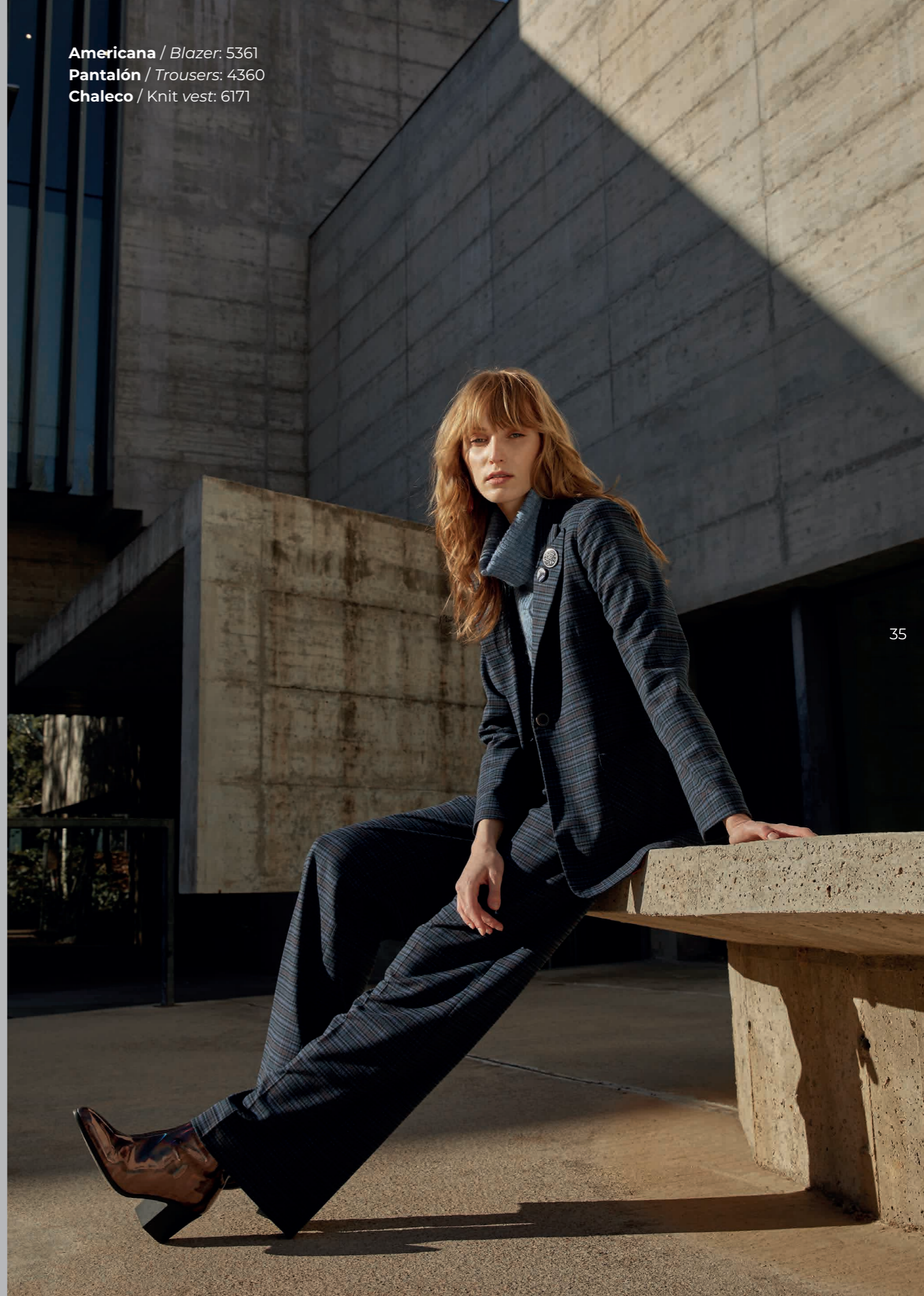
Americana / Blazer: 5361 Pantalón / Trousers: 4360 Chaleco / Knit vest: 6171