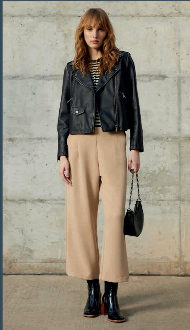
Cazadora / Jacket: 5050 · Camiseta / T-Shirt: 9391 Pantalón / Trousers: 4540 · Bolso / Handbag: 0003