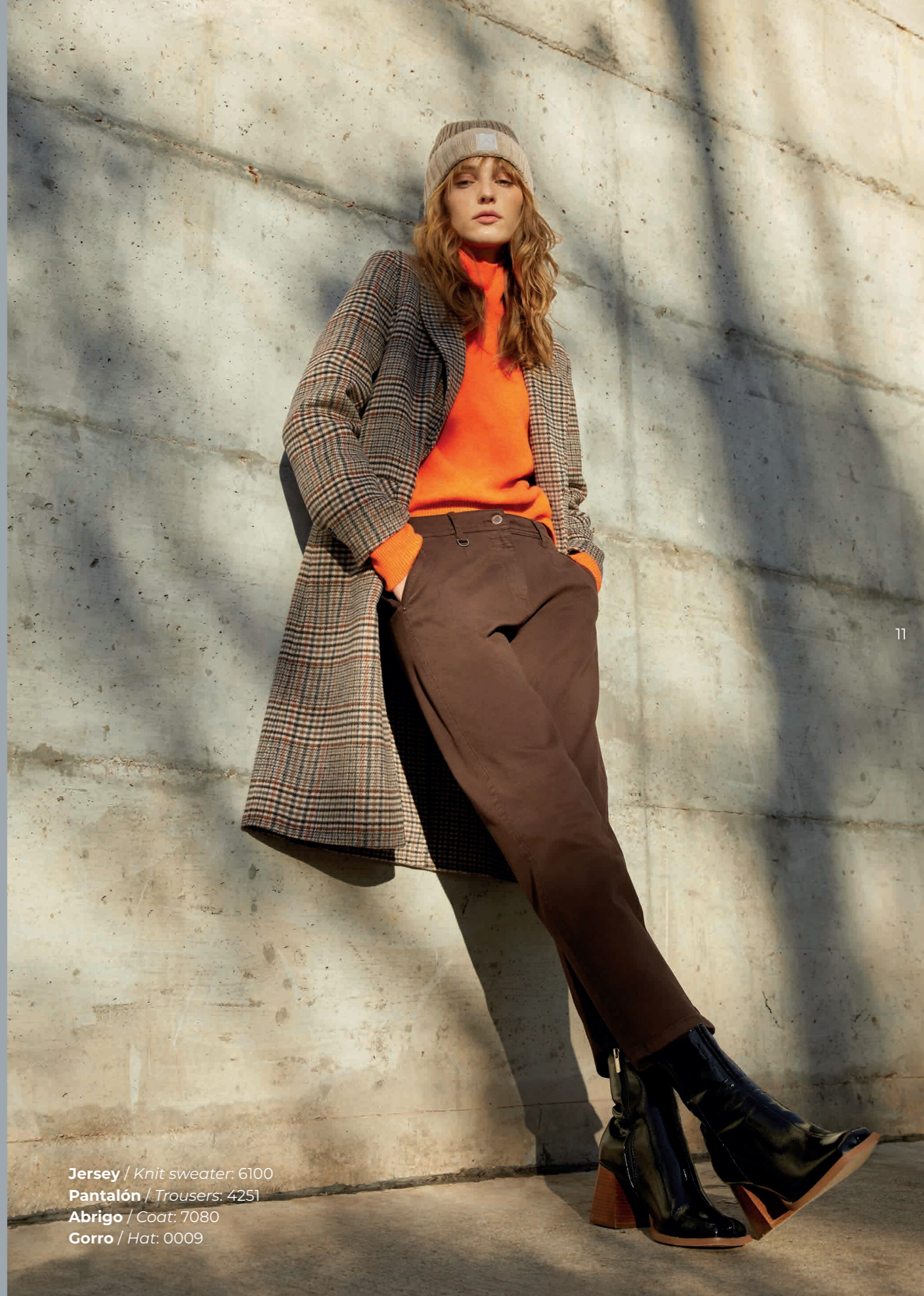
Jersey / Knit sweater: 6100 Pantalón / Trousers: 4251 Abrigo / Coat: 7080 Gorro / Hat: 0009