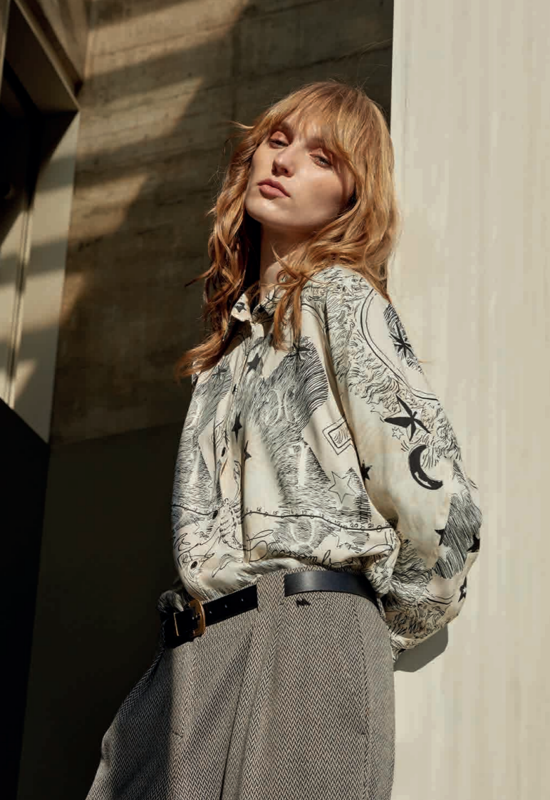
Camisa / Shirt: 2310 · Pantalón / Trousers: 4410 · Cinturón / Belt: 0007