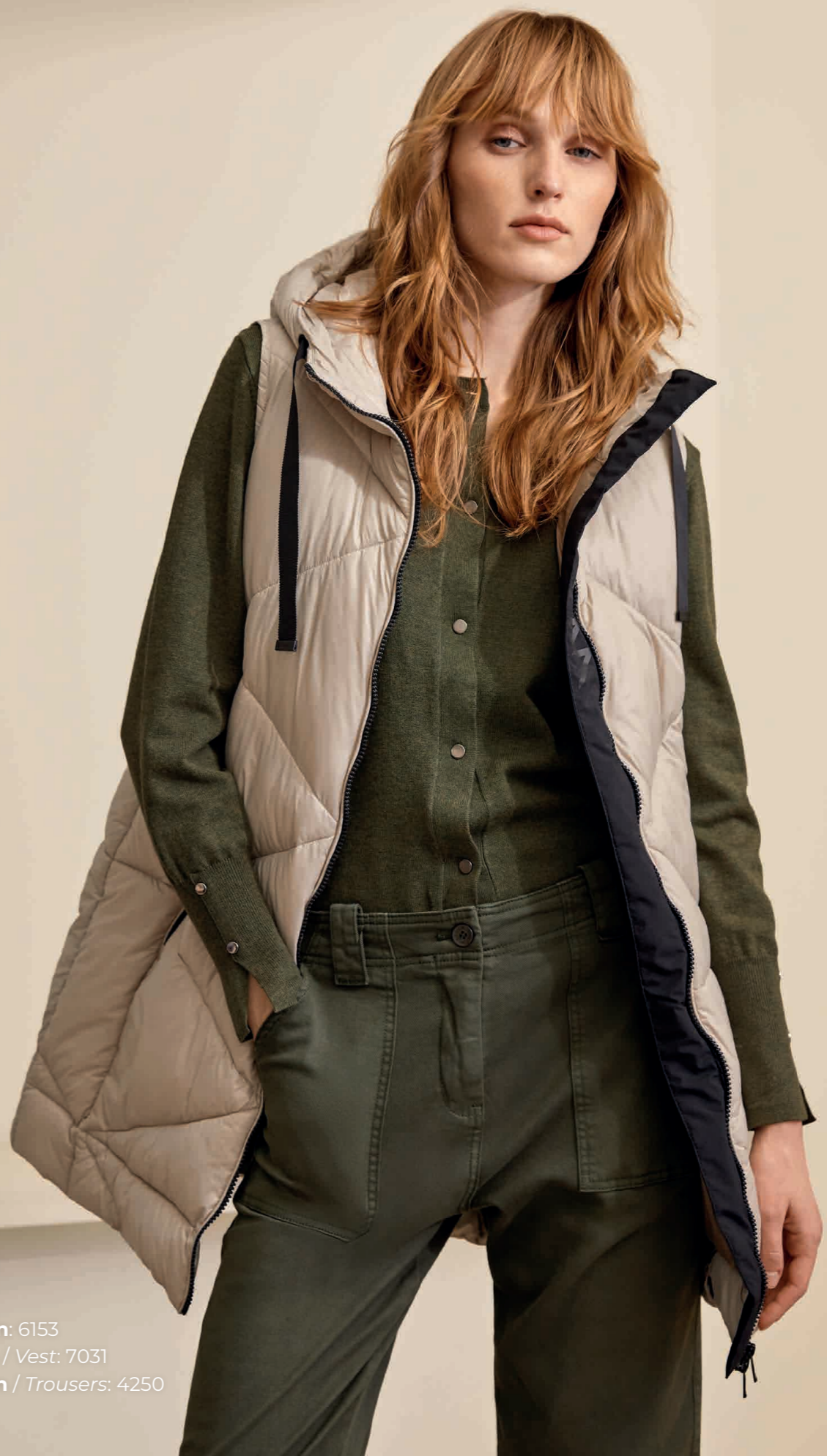
Cárdigan: 6153 Chaleco / Vest: 7031 Pantalón / Trousers: 4250