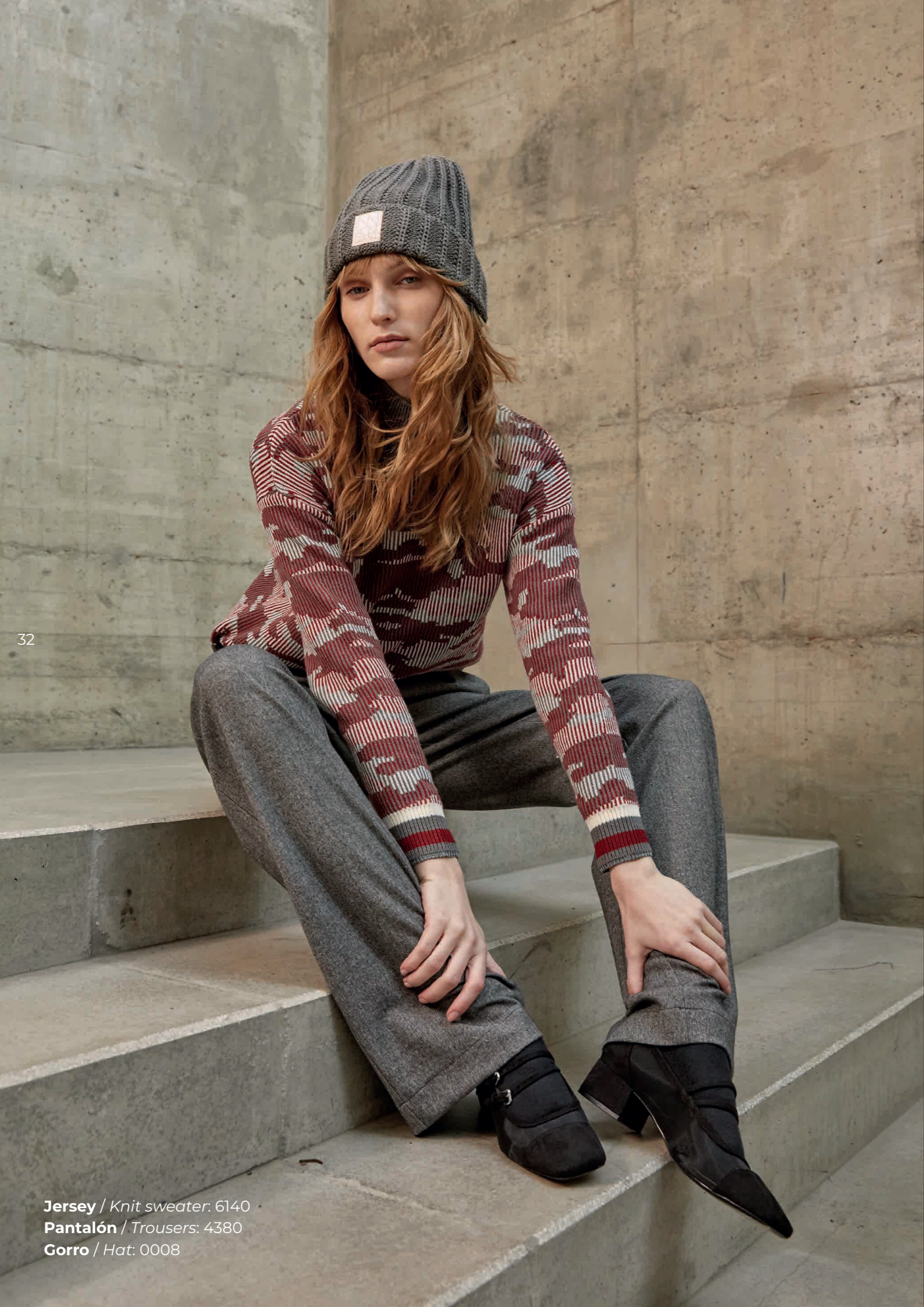
Jersey / Knit sweater: 6140 Pantalón / Trousers: 4380 Gorro / Hat: 0008