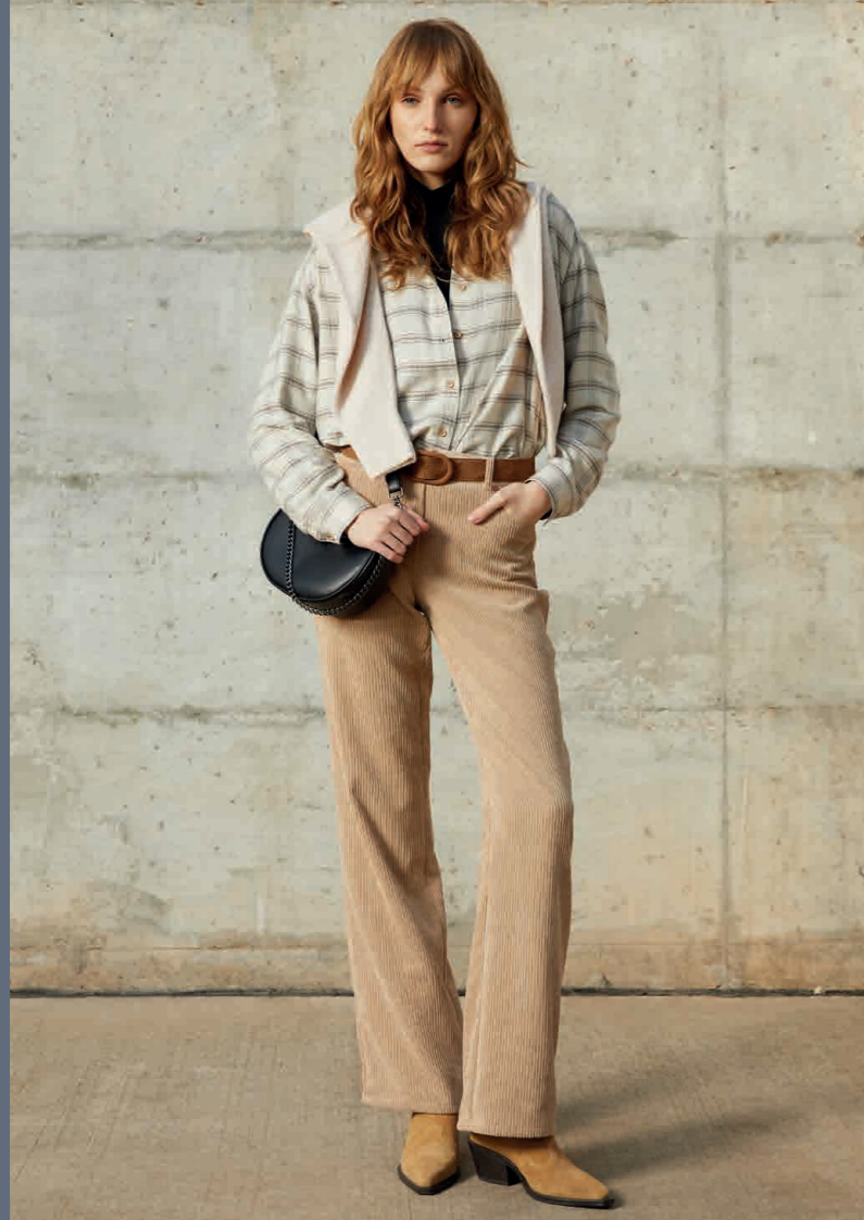
Camisa / Shirt: 2430 · Camiseta / T-Shirt: 9620 · Jersey / Knit sweater: 6103 Pantalón / Trousers: 4510 · Bolso / Handbag: 0003 · Cinturón / Belt: 0006