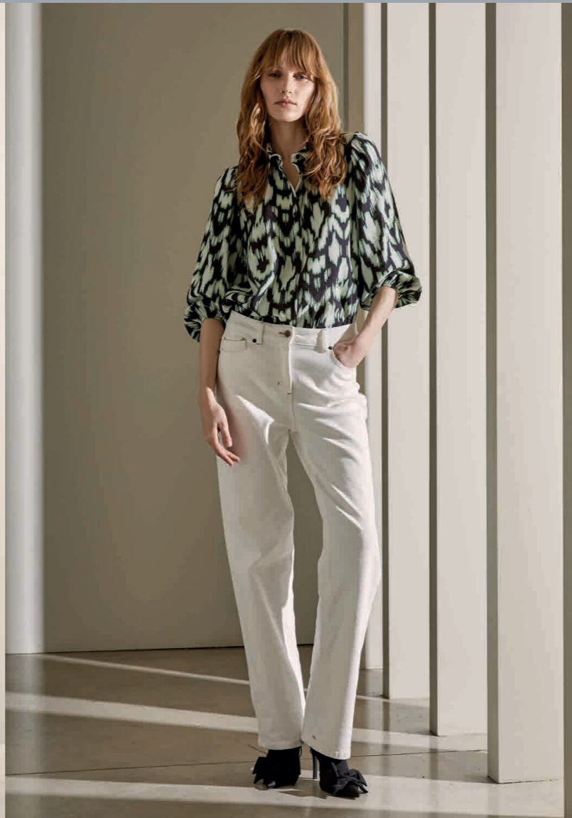
Camisa / Shirt: 2300 Vaquero / Jeans: 4210