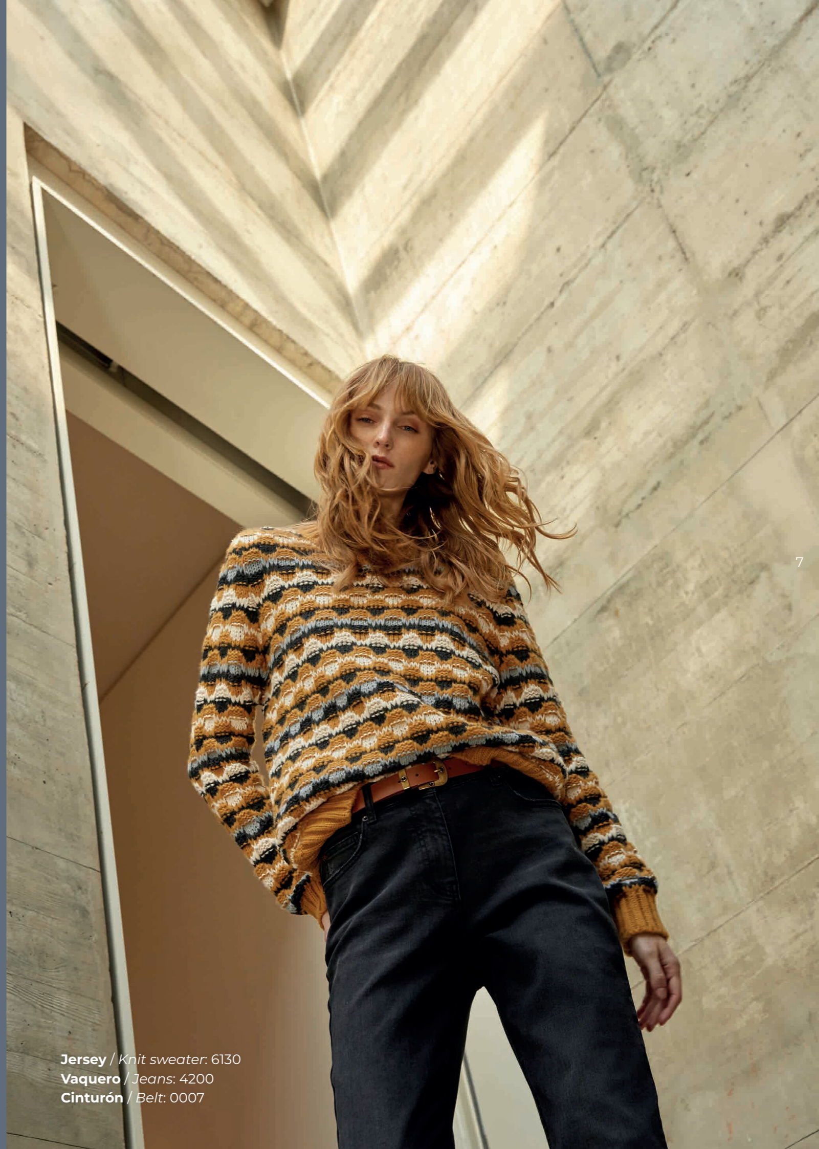
Jersey / Knit sweater: 6130 Vaquero / Jeans: 4200 Cinturón / Belt: 0007