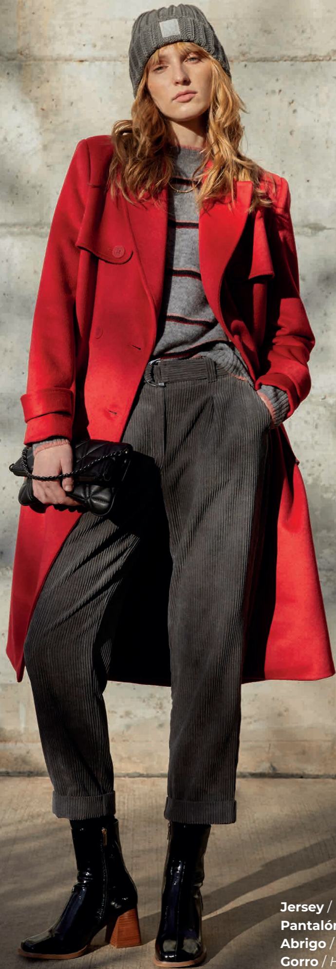
Jersey / Knit sweater: 6180 Pantalón / Trousers: 4511 Abrigo / Coat: 7070 Gorro / Hat: 0008 Bolso / Handbag: 0001