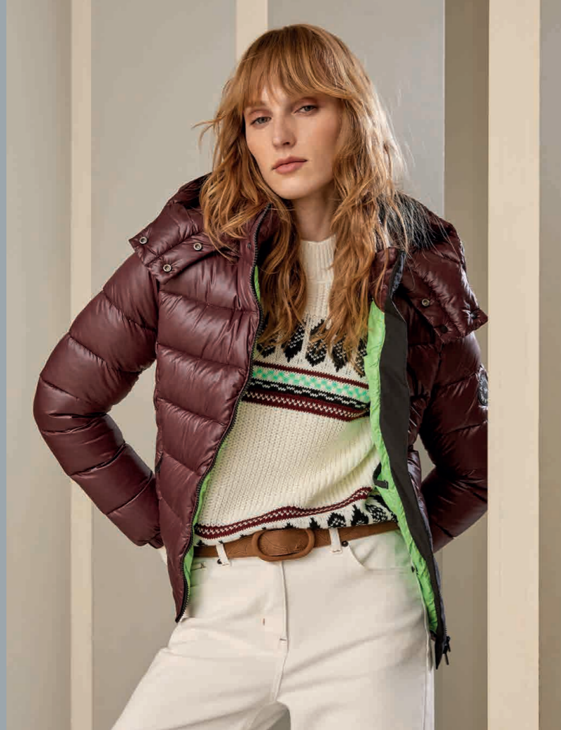
Jersey / Knit sweater: 6110 · Vaquero / Jeans: 4210 · Parka : 7030 Cinturón / Belt: 0006