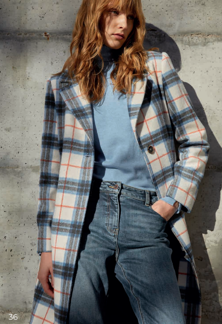
Sueter / Knit sweater: 6150 · Vaquero / Jeans: 4200 Abrigo / Coat: 7450