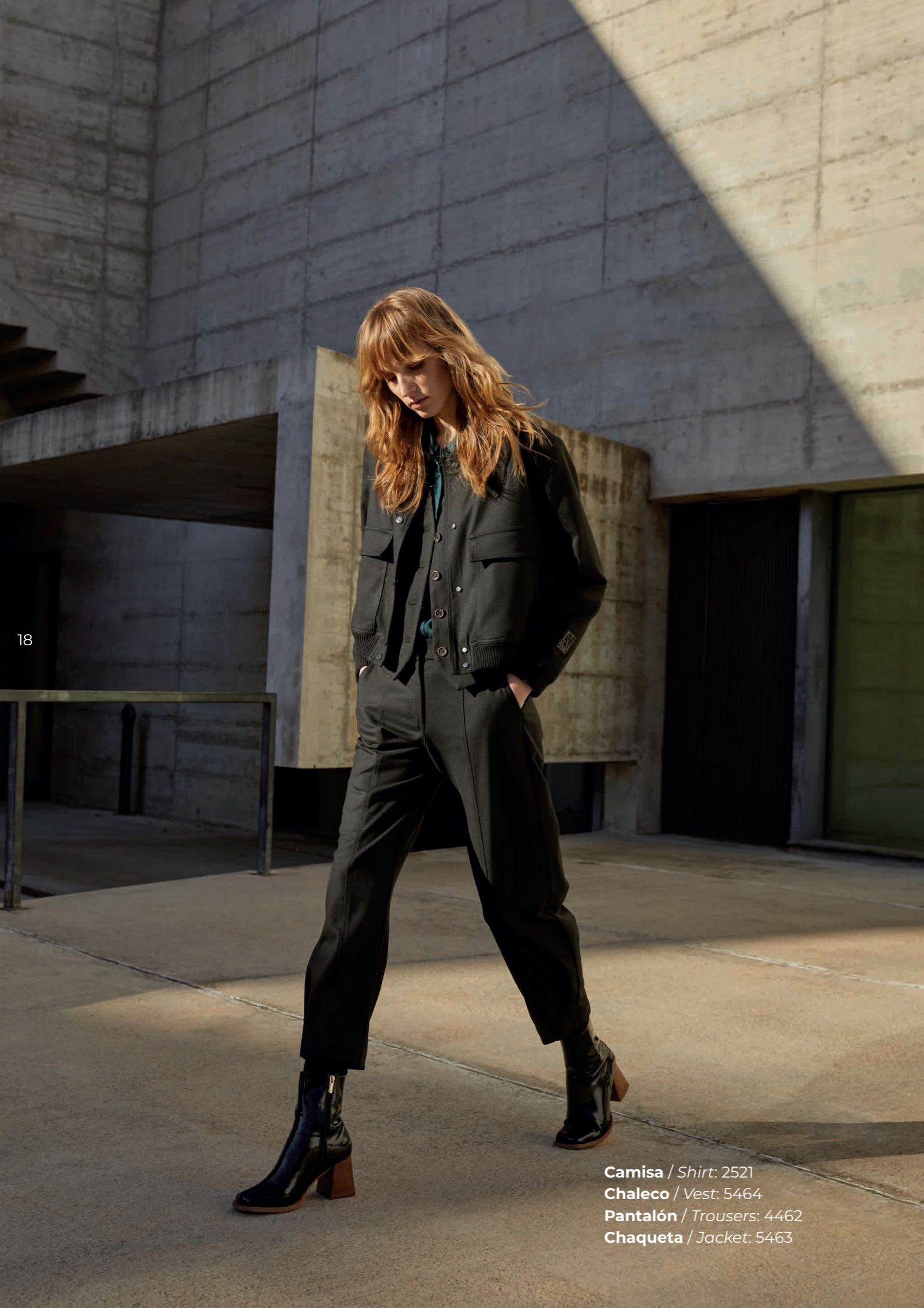
Camisa / Shirt : 2521 Chaleco / Vest : 5464 Pantalón / Trousers : 4462 Chaqueta / Jacket : 5463