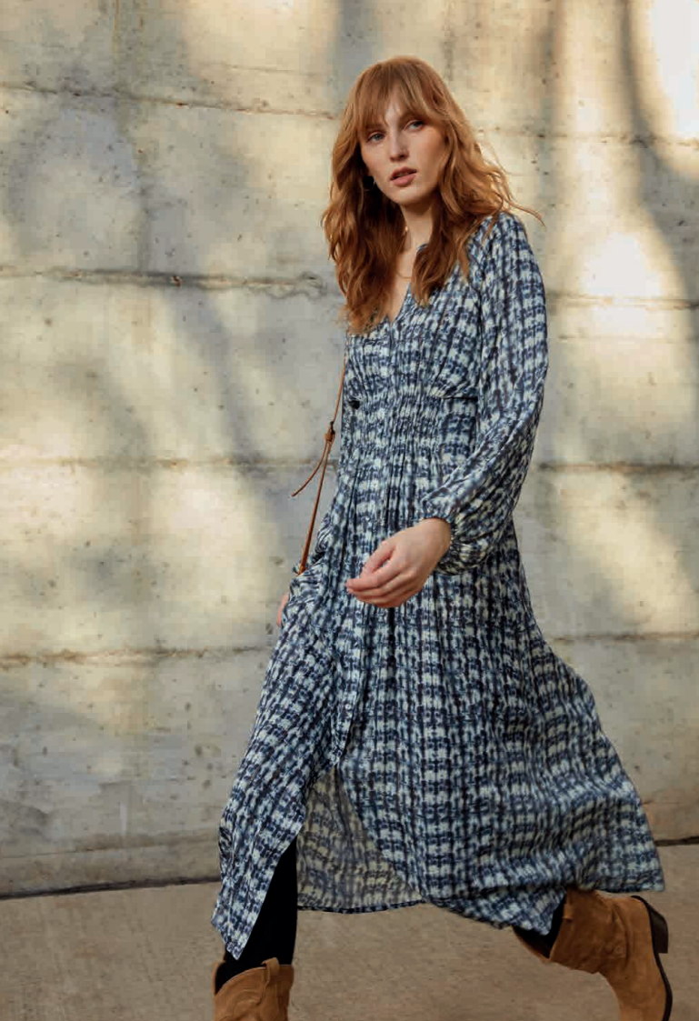
Vestido / Dress: 8341