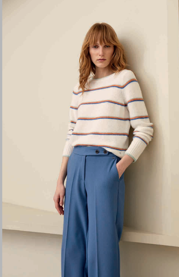
Jersey / Knit sweater: 6180 · Pantalón / Trousers: 4542