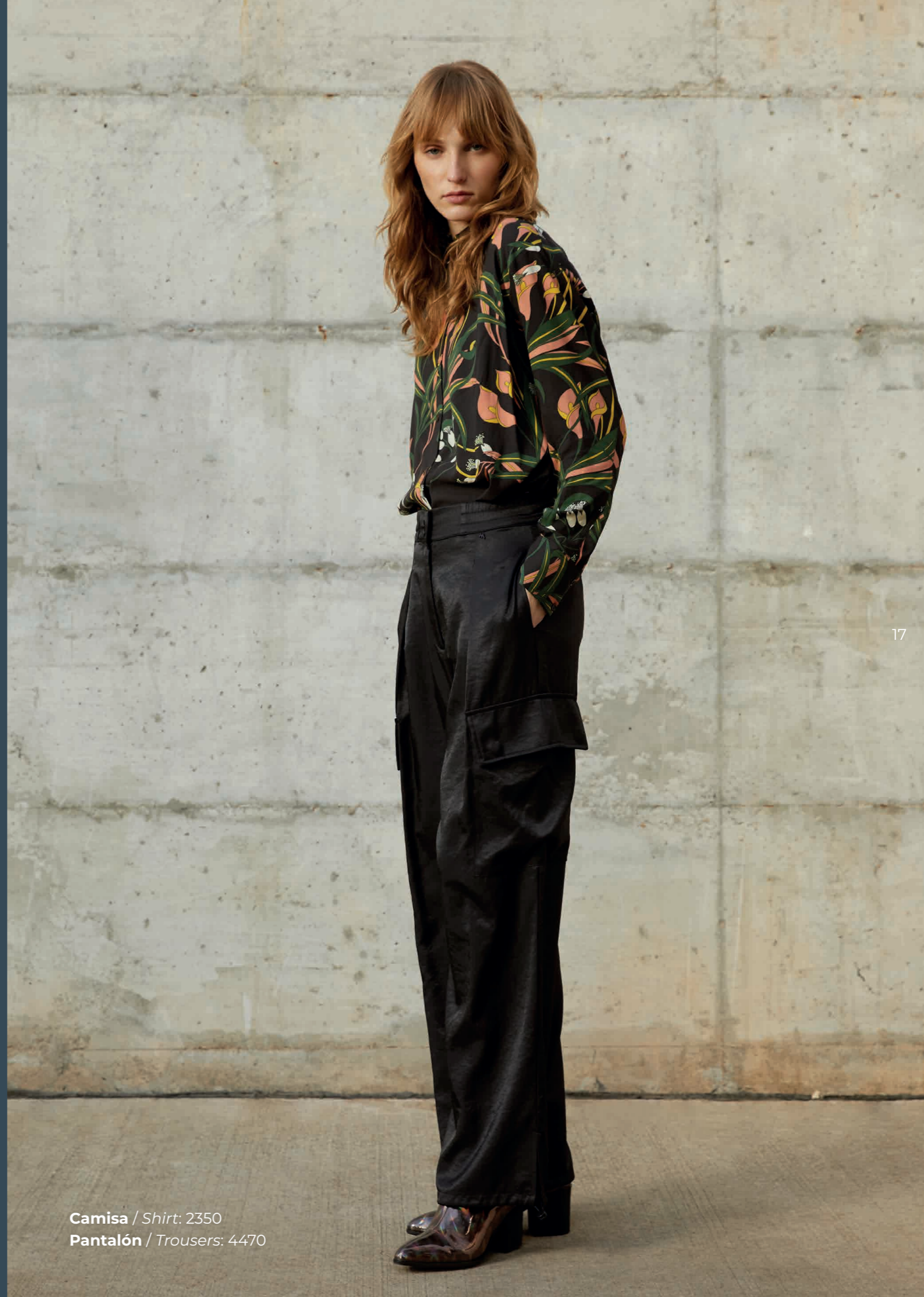
Camisa / Shirt: 2350 Pantalón / Trousers: 4470