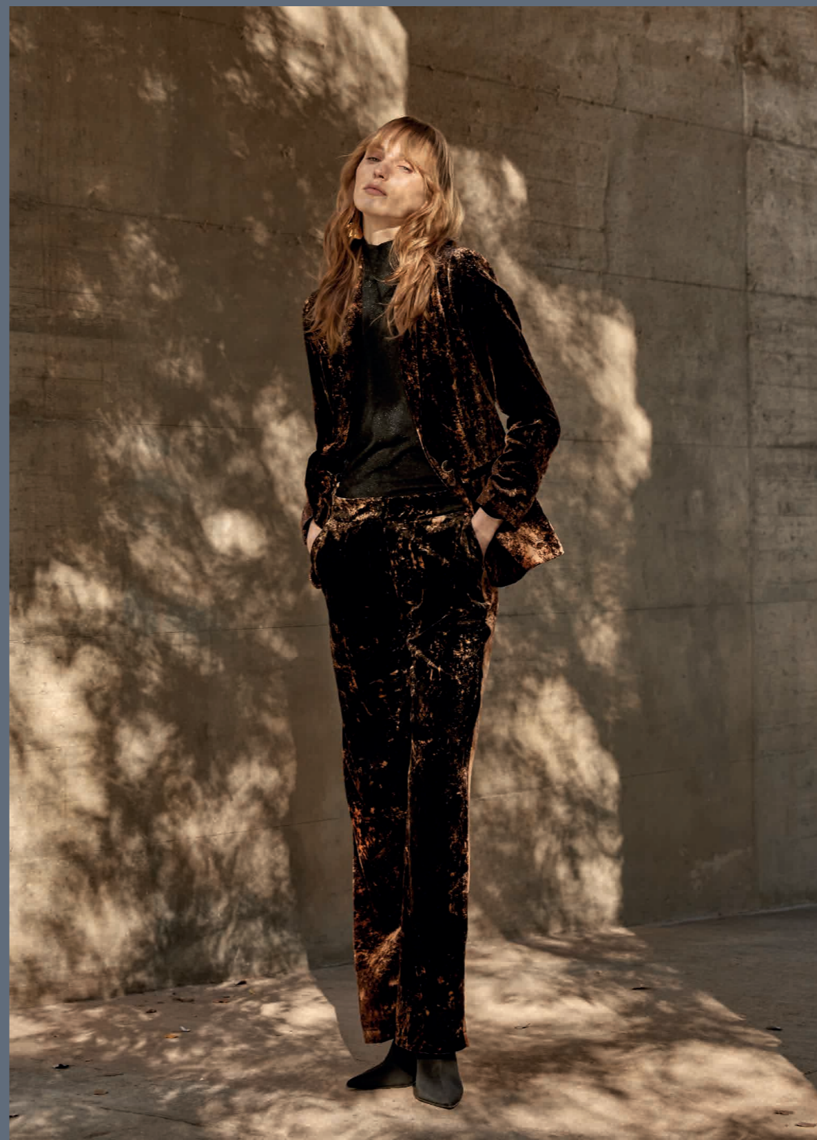
Camiseta / T-Shirt: 6260 Pantalón / Trousers: 4601 Americana / Blazer: 5600